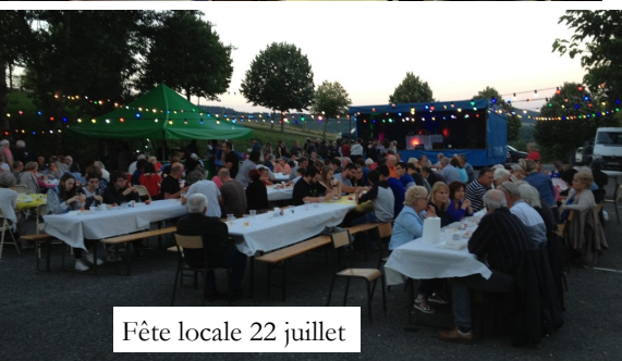
Fête locale 22 juillet