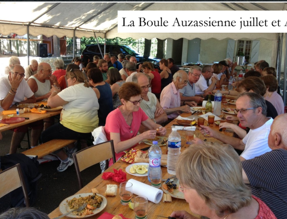
La Boule Auzassienne juillet et Aout