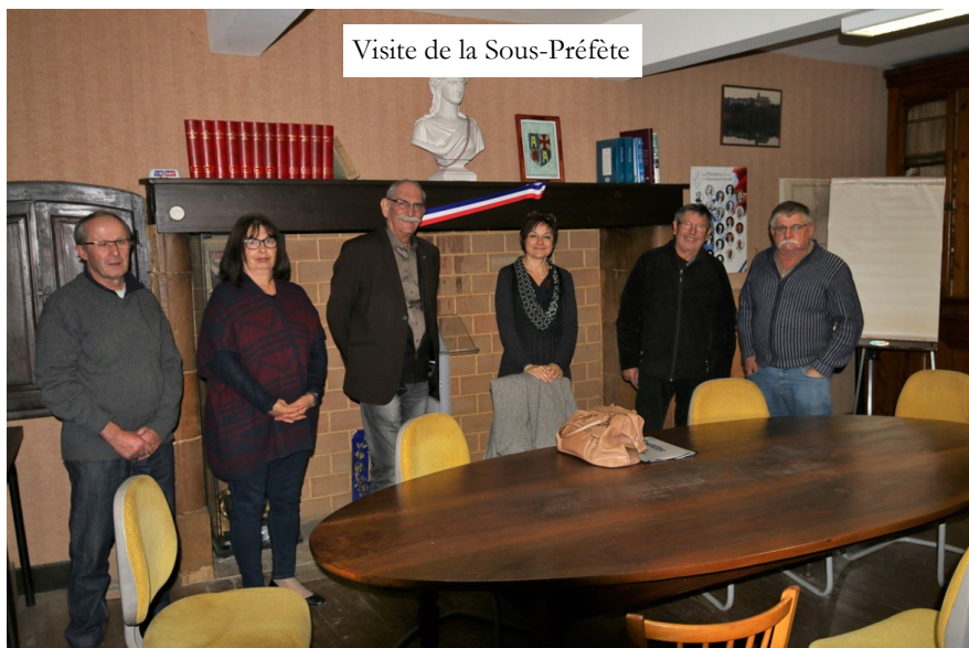
Visite de la Sous-Préfète