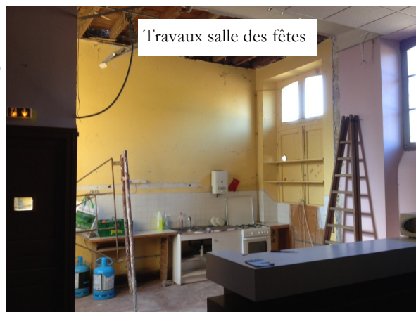
Travaux salle des fêtes

1106 nuitées de camping cars au 1/11/2016 dont 241 étrangers