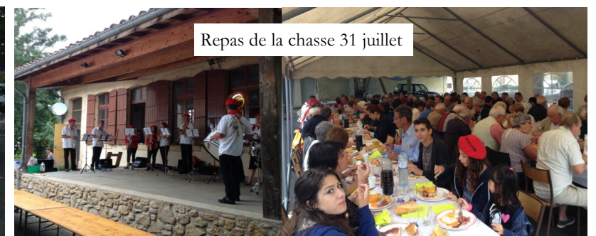
Repas de la chasse 31 juillet