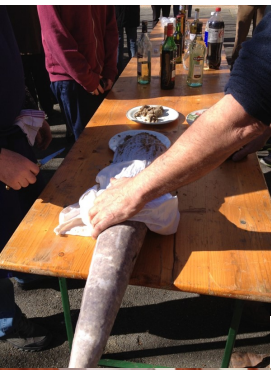
Fête du cochon 14 février

Dans l'ordre chronologique, voici quelques images des activités proposées par les associations d'Auzas ou associations amies et partenaires.