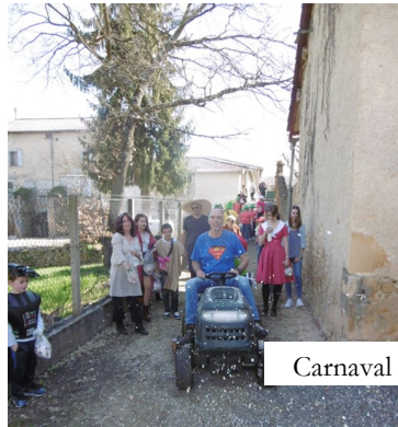
Carnaval 26 février