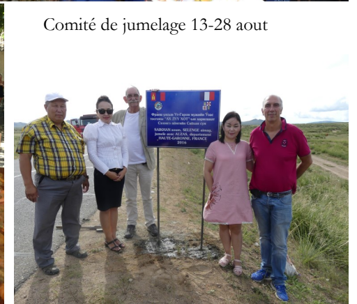
Comité de jumelage 13-28 aout