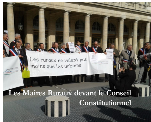
Les Maires Ruraux devant le Conseil Constitutionnel

En matière de finances locales, si la baisse des dotations est toujours inchangée (-10% par ans pendant trois ans), nous avons pu obtenir l'étude de la révision de l'attribution de cette dotation qui défavorise outrageusement les communes rurales. Petit rappel une commune rurale touche deux fois moins de subvention par habitant qu'une commune urbaine. Un rural vaut-il deux fois moins qu'un urbain ?!